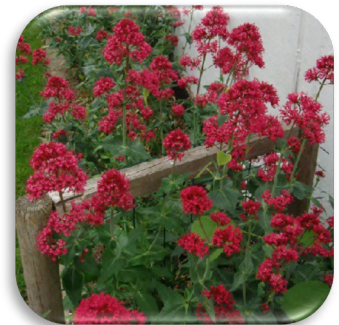
Centranthus ruber 'Coccineus'