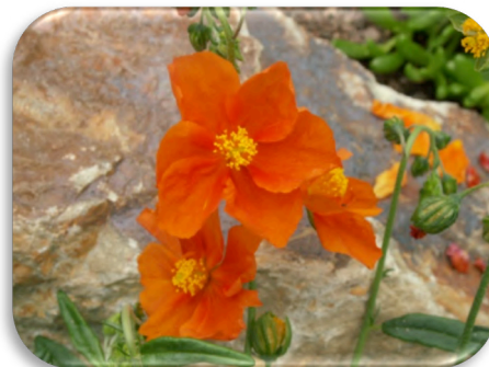
Helianthemum 'John Laynan'