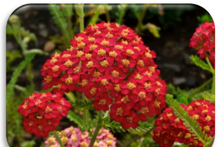
Achillea millefolium 'Paprika'