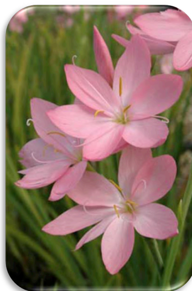
Schizostyllis 'Mrs Hegarty'