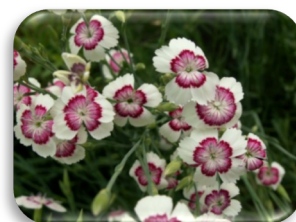
Dianthus deltoides 'Arctic'