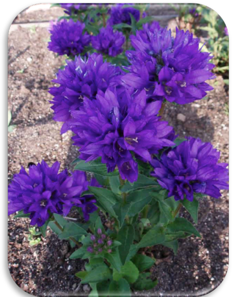
Campanula glomerata 'Superba'