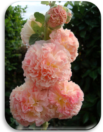
Alcea rosea 'Plena Salmon'

Alchemilla , l'alchémille fait partie des incontournables des parcs et jardins. Plante couvre-sol au feuillage décoratif semi-persistant, elle demande très peu d'entretien et à une croissance assez rapide dans la plupart des situations. Soleil ou ombre. 3pl/m 2 .