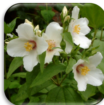
Philadelphus 'Belle Etoile'