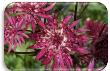
Astrantia major 'Ruby Star'