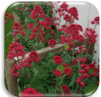
Centranthus ruber 'Coccineus'