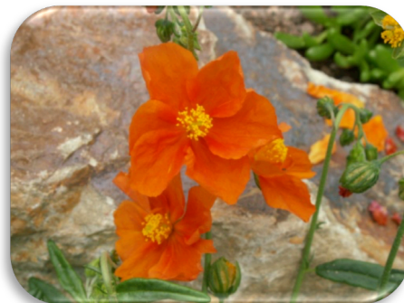
Helianthemum 'John Laynan'