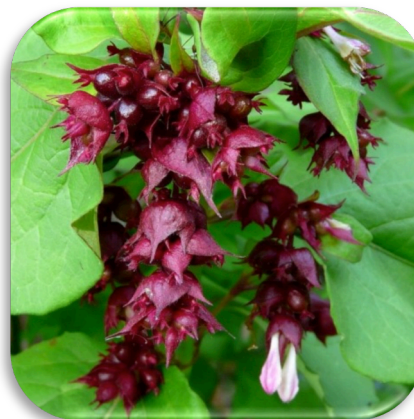
Leycesteria 'Purple Rain'