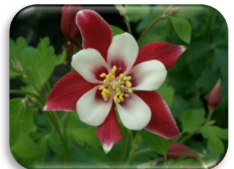
Aquilegia 'Red Hobbit'