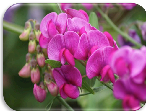
Lathyrus 'Red Pearl'

Savez-vous que ? Pour faire une bonne transition entre les différentes couleurs au jardin, vous pouvez planter dans vos massifs diverses variétés de graminées. Retrouvez notre assortiment page 62.