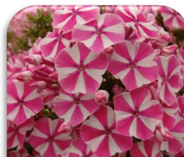
Phlox panicu. 'Pink Twist'