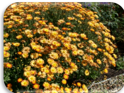
Dendranthema 'Dernier Soleil'

Dianthus , les œillets... également représentés par un large assortiment dans notre pépinière. Il s'agit principalement de plantes vivaces destinées à la culture en rocailles, bordures, et pots. Feuillage persistant, parfum, longue floraison d'été, que de qualités pour une plante de culture assez facile en terrain bien drainé et au soleil. 5pl/m 2 .