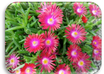
Delosperma 'Jewel of Desert'