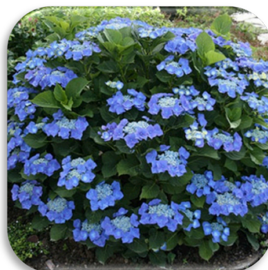
Hydrangea 'Teller Blue'