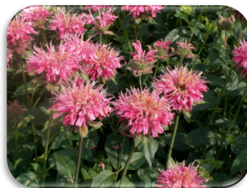
Monarda 'Marshall Delight'