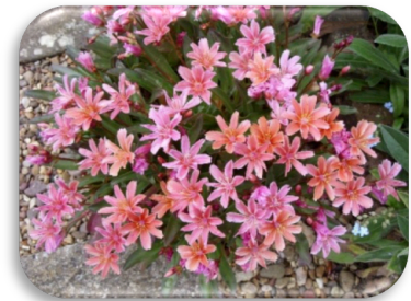
Lewisia 'Little Plum'