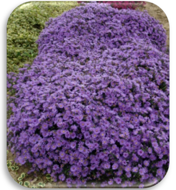
Aster dumosus 'Augenweide'

Astilbe , bonne plante pour les endroits plutôt ombragés et humides. Plante de culture facile à longue floraison estivale. Soleil ou ombre. Feuillage décoratif. 3pl/m 2 .