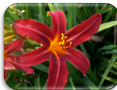
Hemerocallis 'Crimson Pirate'