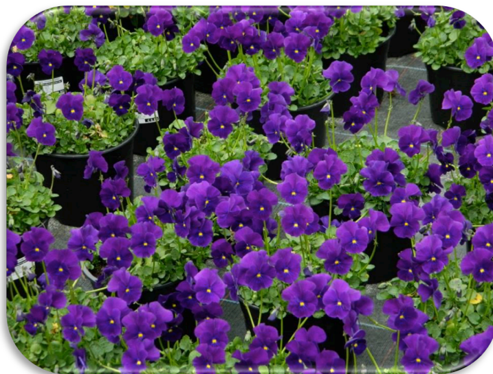
Viola 'Martin', depuis toujours,

la plante la plus demandée dans notre pépinière !