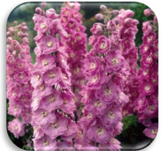
Delphinium 'Pink Power'