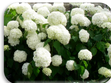
Hydrangea arborescens 'Annabelle'