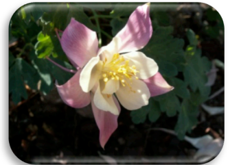
Aquilegia 'Rose Queen'