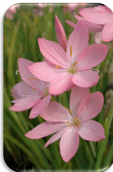
Schizostyllis 'Mrs Hegarty'