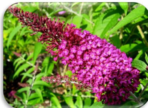
Buddleja 'Royal Red'