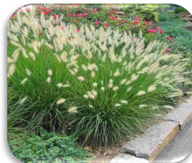
Pennisetum alop. 'Hameln'